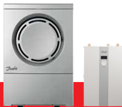
Luft/vand varmepumpe DHP AQ