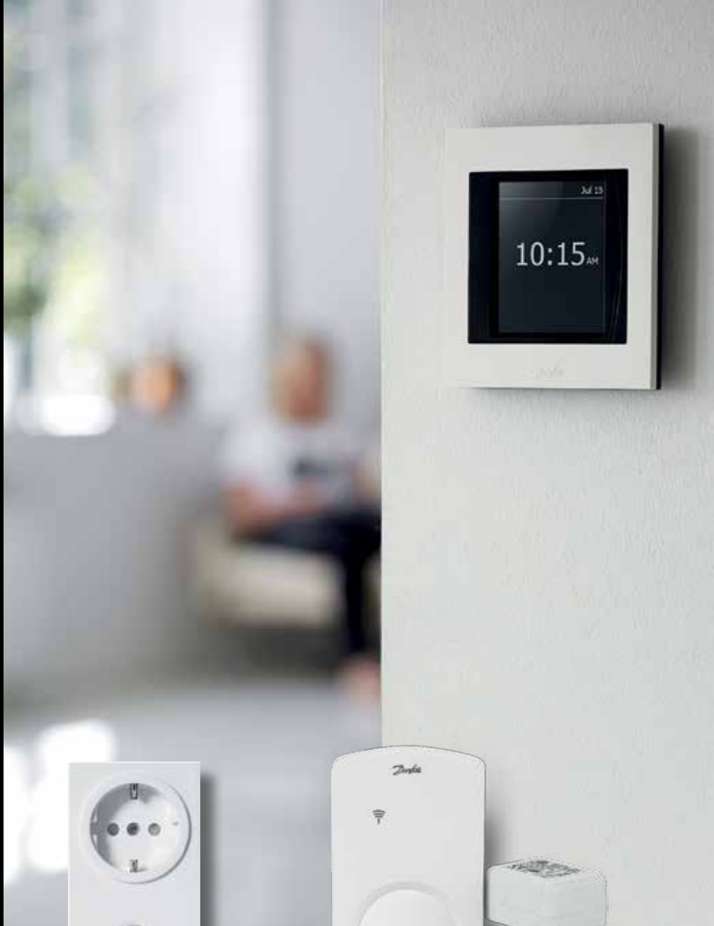
Relæ til stikdåse Danfoss Link ™ PR

Danfoss tilbyder en stikkontaktrelæ, der gør det muligt at integrere og kontrollere elektriske enheder. Den giver nem tilslutning af elektriske apparater og de kan aktiveres og tidsstyres via en tænd/sluk-funktion på Danfoss Link ™ CC.